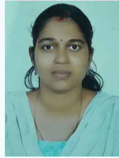
പ്രിയ കെ. ജെ.

മഴയേ, നീ എന്നെ വീട്ടുപോകണമേ നിന്നെ ഞാൻ വെറുത്തുപോകും മുന്നേ, നീ എന്റെ നെൽപ്പാടങ്ങളേയും കൃഷിയിടങ്ങളേയും മുക്കിക്കൊല്ലരുതേ, എന്റെ തോട്ടങ്ങളെ നിർവ്വീകാരമാക്കല്ലേ. മഴയേ, നീയെന്റെ പണിയാളന്റെ പണിമുടക്കല്ലേ. എന്റെ അടുപ്പിനകത്തേക്കിറു വീഴല്ലേ എന്റെ കുഞ്ഞുങ്ങളുടെ ചോറ്റുപാത്രങ്ങളെ, കിടക്കപ്പായയെ ഒഴുക്കിക്കളയരുതേ മഴയേ നീയെന്റെ നാളെയുടെ കതിർസ്വപ്നങ്ങളെ മോഹത്തിൻ മലരുകളെ കൊന്നൊടുക്കല്ലേ, മതി നിന്റെ പ്രണയവും പ്രളയവും പരിഭവവും മഴയേ നീ പോയ് വരു മറ്റൊരു നാളിലായ് വരവേറ്റിടാം ഞാൻ നിന്നെ ഏറെ സ്നേഹത്തോടെ!