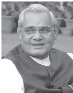
എ.ബി. വാജ്പേയി മുൻ പ്രധാനമന്ത്രി